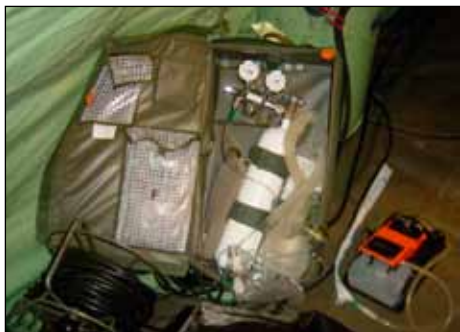
Syrgasapparat och sugpump på förbandsplats.

inom 60 minuter från skadetillfället. Här görs livräddande åtgärder för att säkerställa fri luftväg som t ex koniotomi (strupsnitt), inläggning av thoraxdränage samt insättande av intraossial nål (läkemedel och dropp som ges direkt i benmärgen). På förbandsplatsen arbetar två legitimerade läkare, två legitimerade sjuksköterskor, fyra militära sjukvårdare samt en väbel.