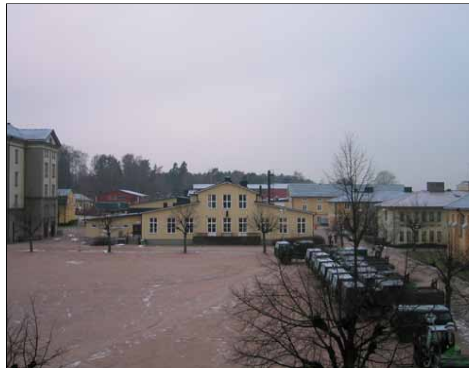
Matsalen 2006. Genom en lång utgrävning under södra delen av matsalen, s k köhall, kommer de värnpliktiga upp i matsalen framme vid utspisningsdisken. I militärrestaurangen finns matsal för värnpliktiga med 360 sittplatser och personalmatsal med 170 sittplatser.