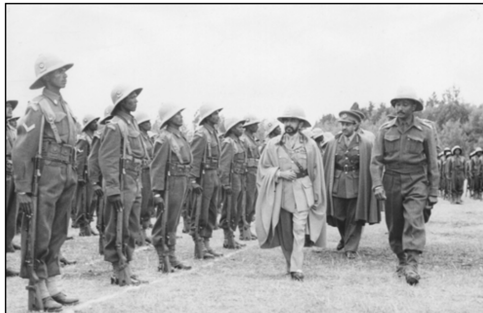
Kejsar Haile Selassie, åtföljd av kronprinsen och bataljonschefen, inspekterar II. Koreabataljonen före avresa 1952.