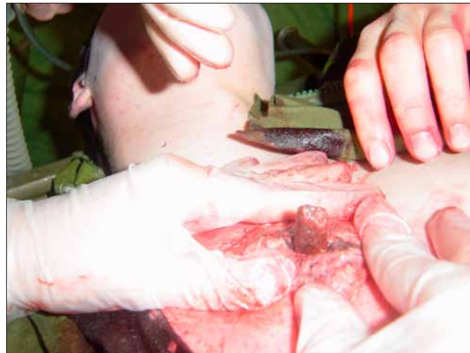
Öppen bröstkorgsskada, främmande kropp.