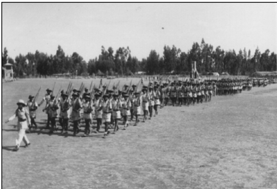
III. etiopiska Koreabataljonen tränar inför avskedsparaden i Addis Abeba i mars 1953.

Ännu en bataljon utbildades. III. bataljonen reste till Korea i april 1953 och II. bataljonen kom tillbaka i juni samma år. Sammanlagt sände Etiopien nära 4 000 man till Koreakriget, innan detta upphörde i juli 1953.