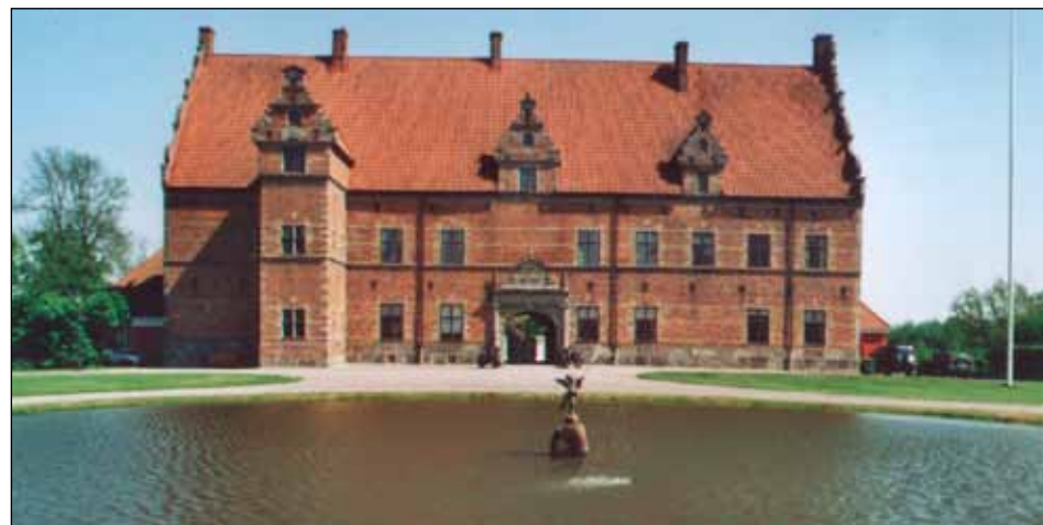
Slottet Svenstorp där den danske och svenske kungen bytte högkvarter. Kungarna sov i rummet längst ner i den utskjutande delen.

tatissallad med tillbehör sköljdes ned med öl och vin, på samma plats där Wästgötha-Dals knektar bl a försvarade det svenska artilleriet den 4 december 1676. Avslutningsvis besöktes slottet Svenstorp där både den danske och