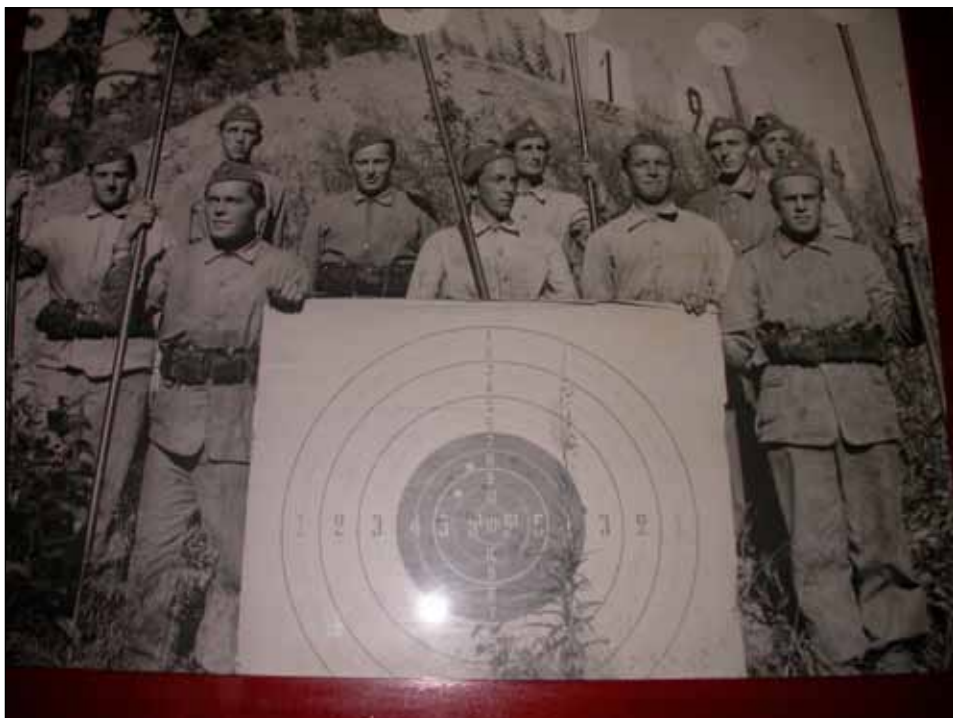
Gamla metoden med manuell markering ("markörspadar") och tioringad precisionstavla.

Banan har nu varit i bruk under fem och ett halvt år och har fungerat alldeles utmärkt.