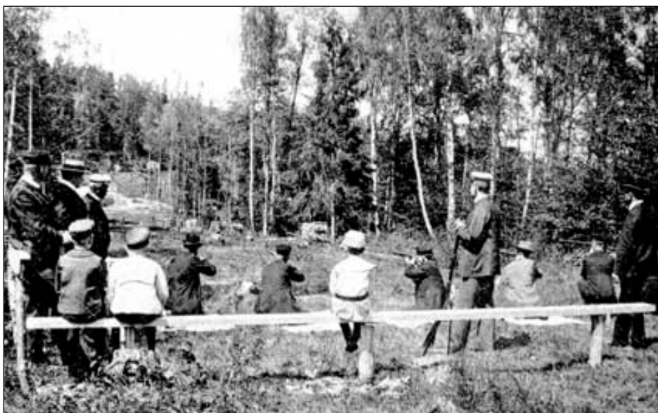
Före ”Säkl” kände skytterörelsen inga begränsningar, här en vy från 1904.

Nu fanns ett förstklassigt vapen, men kunde detta användas inom skytterörelsen? Vapnet hade ju en helt annan räckvidd än gamla 1860 och liknande. Det krävde större säkerhet vid skjutbanorna och det kostade också en hel del. Inom Försvarsmakten hade man förstått vapnets förträfflighet. Man beslöt att inköpa 5 000 gevär m/96, att lånas ut eller säljas till skytteföreningarna. Priset blev 52 kr per styck.