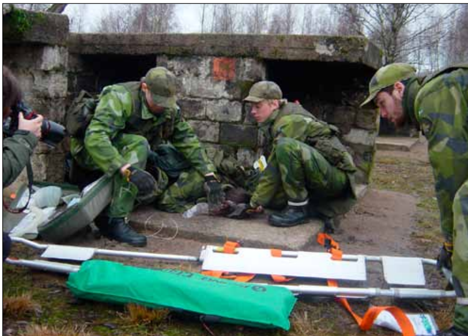
Omhändertagande på skadeplats av sjukvårdsgrupp med scoopbår.

Således skall patienten – inom de tidsgränser som nödvändiggörs av biologiska förlopp vid skada och sjukdom – alltid ha tillgång till rätt medicinsk kompetens på alla nivåer. Patienten skall också ha tillgång till rätt utrustning samt läkemedel.