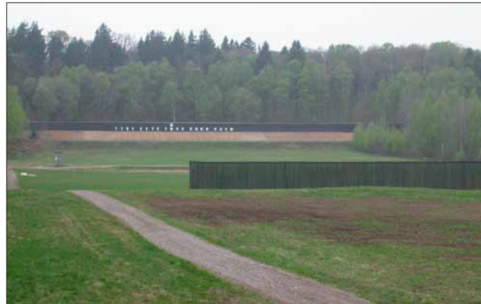
Skjutbanan med 20 kassetter för akustisk markering.

Detta har medfört att skjutpassen för soldaten har kunnat göras mer effektiva. Men vi har inte nöjt oss med detta!