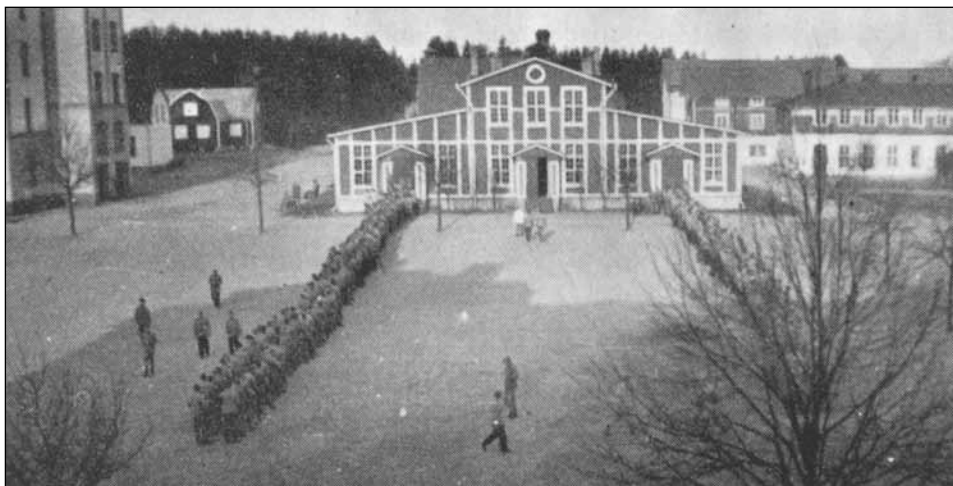
Bild av matkö från 1937. Matsalen var färdig samtidigt med kasernerna som invigdes 1907.