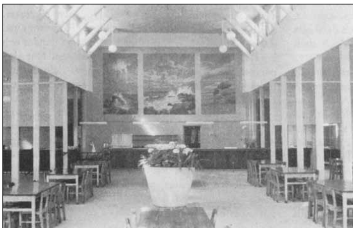
Denna bild från 1957 visar del av utspisningshallen med fonddekoration, ett Tylösandsmotiv av dekorationsmålaren Edw. Högarth från 1939. Observera de synliga takstolarna. Dessa togs bort vid en ombyggnad under senare delen av 1960-talet då man inredde en andra våning för att erhålla en reservmatsal.