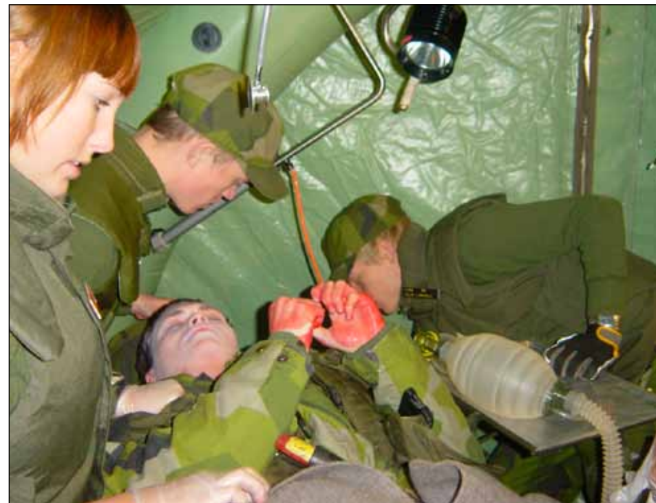
Omhändertagande av bröstorgsskadad i operationsdelen på förbandsplats.

Kursen har varit och är en uppdragsutbildning inom Högskolan i Halmstad. Merparten av utbildningstiden sker på sjukvårdsskolan Lv 6. Bibliotekskunskap sker på MHS H (Militärhögskolan i Halmstad) samt enstaka lektioner/föreläsningar på Högskolan i Halmstad. Eftersom sjukvårdarens huvuduppgift är att assistera legitimerad personal, d v s sjuksköterskor och läkare, ingår även övningar där detta samarbete sker.