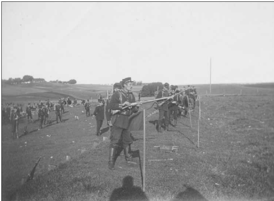
Klassiskt gevär på klassisk mark, m/96 på Skedalahed 1904.

Ett sådant bud kunde man inte motstå. Föreningarna svarade med att bygga säkra skjutbanor. Banorna var små, ofta endast fyra till åtta tavelställ. Av gamla handlingar kan man se att förbundet hjälpte föreningarna med ekonomin för de nya banorna. Ett så kallat hisstavelställ kostade kanske 20 kronor. Förbundet bekostade huvuddelen.