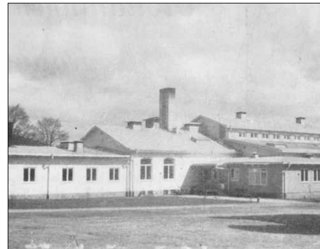
Bild från 1956. Från höger: matsal, kök- inrättning, förbindelsegång till proviantmagasin. Magasinet var från början en fristående gulmålad träbyggnad i tre våningar. Här var även bostad för köksföreståndaren, en underofficersbefattning. Proviandmagasinet revs 1980 och en ny byggnad för modern livsmedelshantering uppfördes. Observera skorstenen som tillhörde matinrättningens egen panncentral.