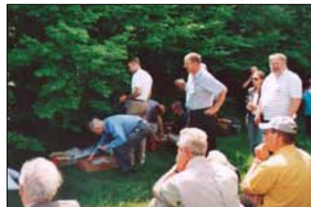
Hungriga kamrater stressar matutdelarna. Trots att vi satt på Lunds gamla soptipp smakade kassler och potatissallad utmärkt.

redogjorde där för hur slaget gick till. Därefter besöktes plats efter plats på slagfältets mest intressanta scenarier. Vi njöt av vackert väder och ciceronens charmiga sätt att levandegöra historien med många roliga utvecklingar.