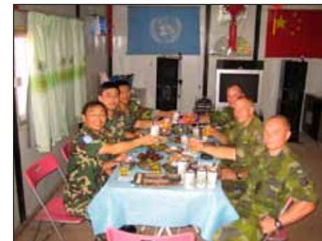
Samverkan med kinesiskt fältsjukhus.

Vad framtiden sedan har att erbjuda den svenska insatsen i Afrika är ovisst. Vårt mandat här för UNMIL har numera utökats till att omfatta även Sierra Leones, när landets egna FN-trupper nu drar sig ur. Oroligheter i angränsande länder som Elfenbenskusten och Guinea visar på behovet av en kraftfull insatsstyrka som snabbt kan gripa in för att återskapa ordningen. Kanske skulle ett mandat för en så pass stark insatsbataljon som vår gälla för hela Västafrika? Tiden får utvisa vad som kommer att ske. Nu väntar dock andra utmaningar för svenskarna i Liberia,