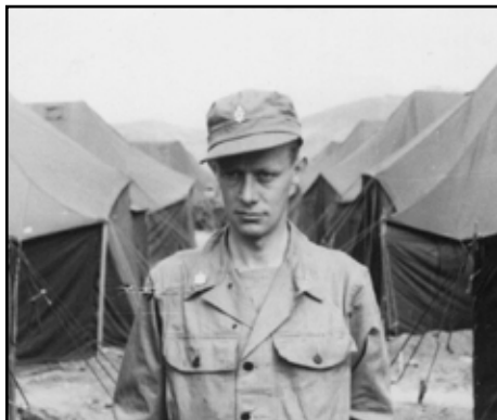
Artikelförfattaren i tältlägret utanför Pusan. Majorstecknet på kragen och etiopiska livgardets emblem i mössan.

Efter återkomsten från Korea blev jag ansvarig för Koreautbildningen. Ett ersättningskompani vars manskap skulle ersätta förluster i Koreabataljonen avreste i två omgångar, 120 man i augusti och 230 man i november. En ny bataljon på 1 200 man sändes i två omgångar 1952 varefter I. bataljonen kom hem.