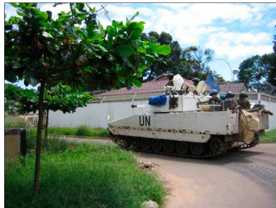
Fordonspatrull i Monrovia.

Liberia ligger i Västafrika och fick sitt namn efter de amerikanska frigivna slavar som immigrerade hit under 1800-talet. Huvudstaden uppkallades efter den dåvarande amerikanske presidenten Charles Monroe och fick således heta Monrovia. Storleksmässigt kan den jäm-