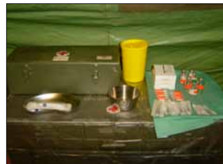
Övningsläkemedel på förbandsplatsen.

Alla värnpliktiga utbildas i första hjälpen inklusive hjärt- och lungräddning (40 timmar), vilket utgör kamrathjälpen. Nästa nivå utgörs av en sjukvårdsgrupp, bestående av en legitimerad sjuksköterska, en militär sjukvårdare, en fordonsförare samt en vagnschef, som inom 30 minuter skall anlända till platsen, påbörja behandling och överta ansvaret för den skadade.