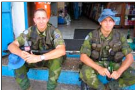
Rast under fotpatrull i Monrovia.

Den svenska insatsen består av totalt 230 soldater, fördelade på ett pansarskyttekompani och ett CSE (contingent support element) och utgör tillsammans med irländare en insatsbataljon (quick reaction force) med utgångsgruppering utanför Monrovia. Chef