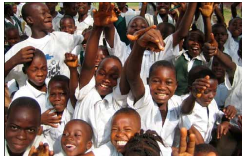
Skolbarnen är gladast åt FN.