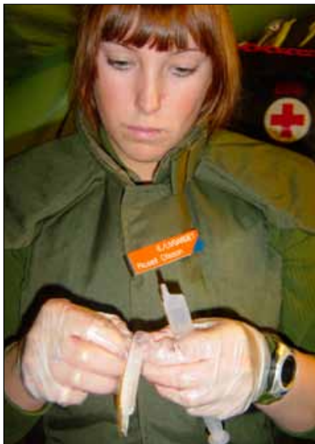
Sjukvårdare som iordningsställer läkemedel.

Försvarsutskottets vice ordförande Tone Tingsgård invigde utbildningen på Lv 6 genom att klippa av ett första förband. Detta var första gången inom Försvarsmakten som 20 poäng var möjligt att erhålla för värnpliktiga sjukvårdare (fem sjukvårdare erhöll 20 poäng). Hösten 2005 återgick vi till 10 poäng eftersom antalet värnpliktiga sjukvårdare var 27 (14 från Lv 6, sju från S 1 och sex från LG (Livgardet).