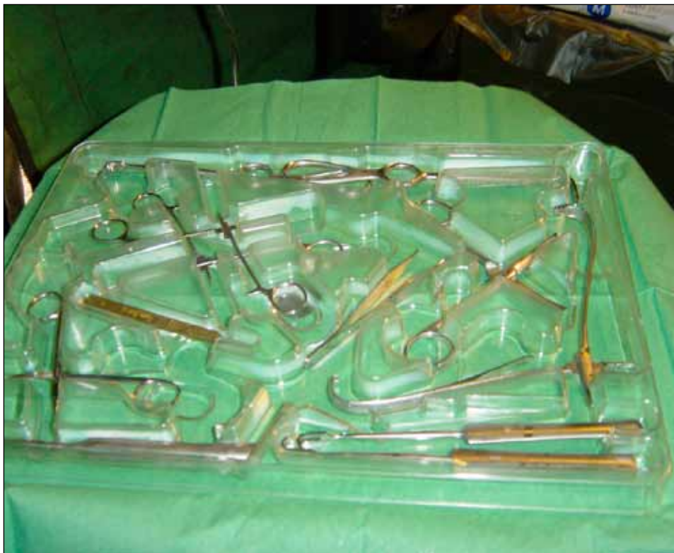
Instrumentbricka på förbandsplats.

Sjukvårdarna har utbildats i nio veckor på sjukvårdsskolan med två kvällstjänster/vecka, och därefter tre veckors kliniska studier på civilt akutsjukhus/ambulansstation på hemorten. Studierna avslutades på sjukvårdsskolan med en uppföljningsvecka av de kliniska studierna. De sjukvårdare som klarar kursen med godkänt betyg, kan eventuellt använda de 10 poängen i en framtida filosofie kandidat- resp filosofie magisterexamen.