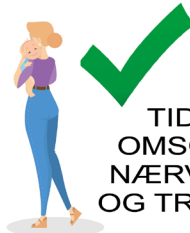
TID TIL: OMSORG NÆRVÆR OG TRØST