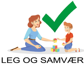
LEG OG SAMVÆR