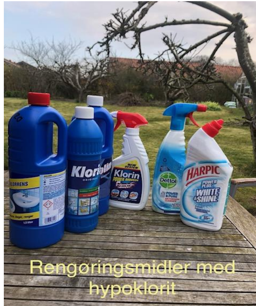
Rengøringsmidler med hypoklorit