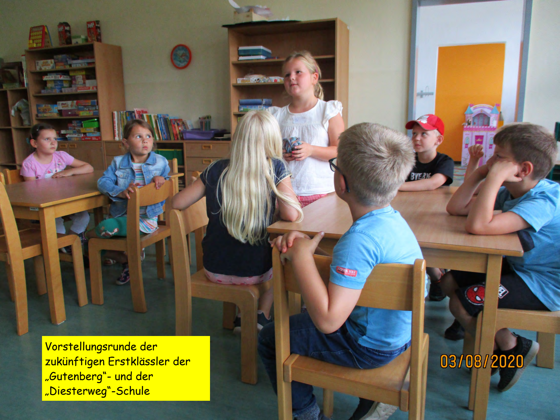
Vorstellungsrunde der zukünftigen Erstklässler der „Gutenberg“- und der „Diesterweg“-Schule