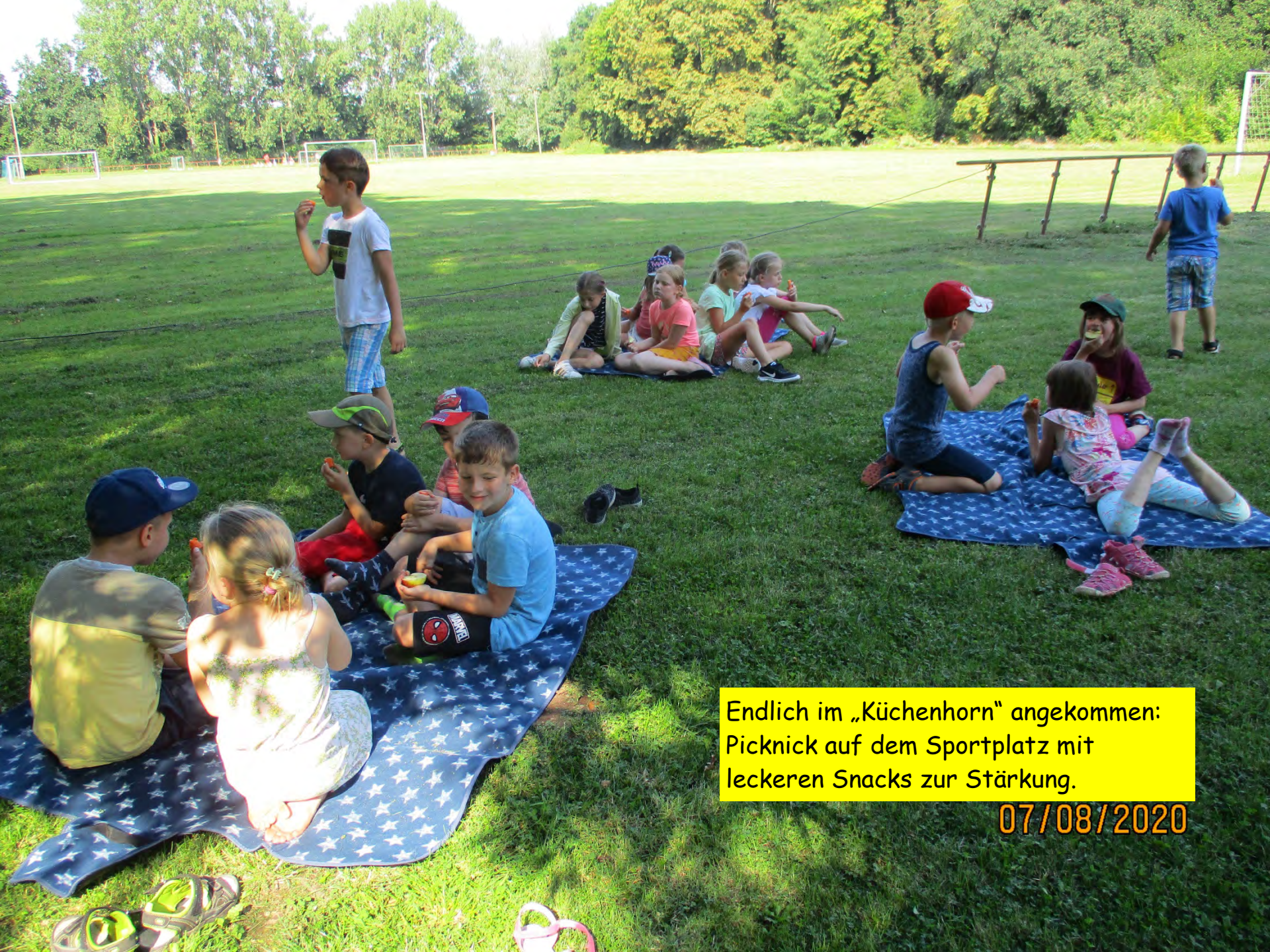
Endlich im „Küchenhorn“ angekommen: Picknick auf dem Sportplatz mit leckeren Snacks zur Stärkung.