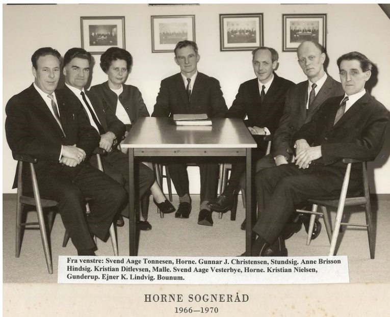
HORNE SOGNERÅD 1966—1970