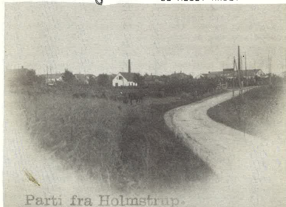
Parti fra Holmstrup.

ÆLDREBOLIGER GENERALFORSAMLING FASTELAVNSFEST RAVNEBJERGMØDER LÆSERBREV OG MEGET ANDET.