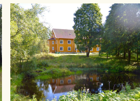
Søen foran Ødegården