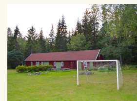
I laden findes der cykler og 2 kuglegrill

Ødegården har egen lille sø foran huset, hvor man kan fange insekter og småfisk med net. Bag huset er der en stor græsplæne med fodboldbane og plads til at spille volley, badminton eller kongespil. Derudover er der en stor bålplads, 2 grill og borde- bænkesæt til fri afbenyttelse. Hele grunden er omgivet af skov og området indbyder til et væld af udendørs aktiviteter.