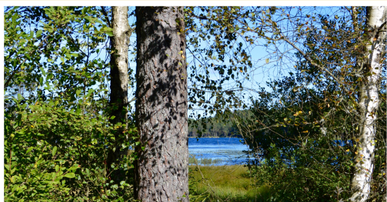
Hallands skovdistrikt dækker et område på størrelse med Fyn

Med færgen fra Grenå til Varberg, er der 3 kvarters kørsel (ca. 70km) til huset.