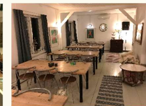
Spisesalen med plads til 40 personer