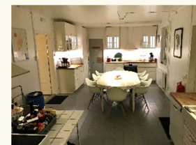
Køkkenet fra 2015

Ødegårdens 400 kvm rummer et nyt køkken med moderne faciliteter og en spisesal med plads til mindst 40 personer. I den ene af husets to stuer er der hjemmebiograf og i den anden, på 1. sal, en 65" fladskærm med dvd afspiller. I stueetagen er der en fordelingsgang med 3 værelser, og på 1. sal en fordelingsgang med 10 værelser. Der er 2-4 sovepladser på hvert værelse. Der er toiletter og baderum på begge etager.