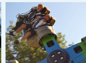
Klubaften på Dyrehavsbakken