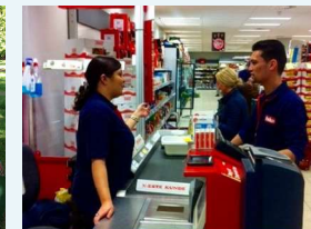
Praktik i Fakta