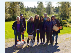
Svampetur i Sverige

Vi udbyder værkstedsfag, It og medier, litteraturværksted hvor man kan skrive sin egen bog eller avis, kreativitet og kunst, bo-undervisning, sejlads, vandring og en række fysisk aktive fag som fitness, svømning, hockey, ridning mv. Skolen har også sit eget værksted i Taarbæk og på vores ødegård i Sverige.