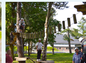
Klatring i Gladsaxe