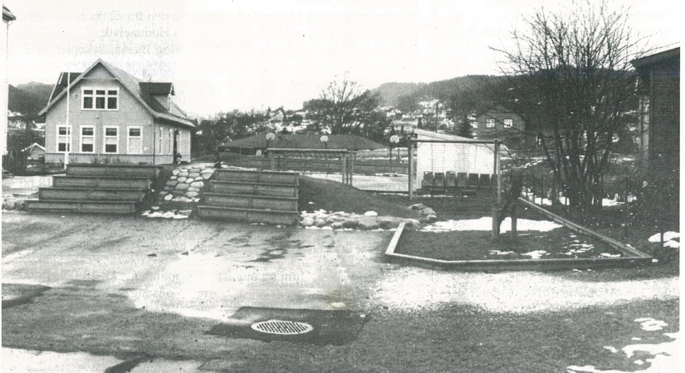
Skolens uteareal etter at skolegårdsprosjektet var gjennomført.