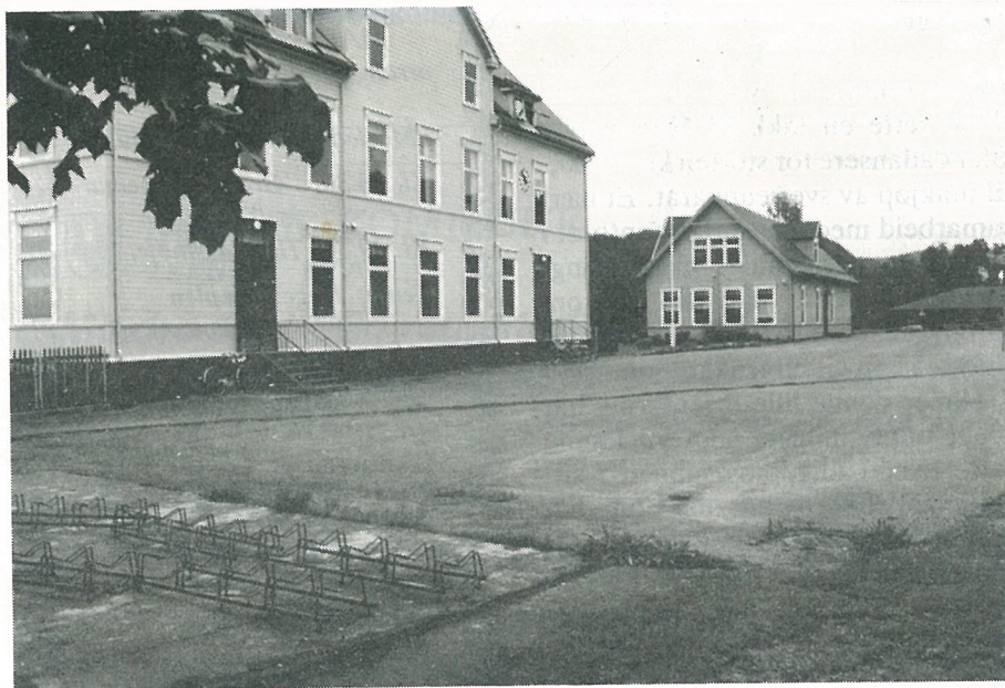
Skolens uteareal før prosjektet ble satt i gang.

Tanken om å gjøre elevene delaktig i planlegging, gjennomføring og vedlikehold av sitt fysiske miljø, er fra skolens side en viktig del av ansvarslæringa hos ungene.