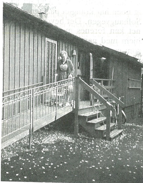
Tilpasning/endring av bygninger og uteareaier