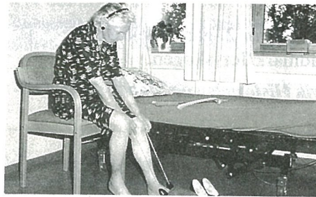
Enhåndshjelpemidler er god hjelp i påkledningen.

Treningskjøkkenet ved institusjonen er forøvrig spesielt utstyrt med tanke på denne pasientgruppen. Der trener de med å lage sin egen mat, dekke bord osv. For oss