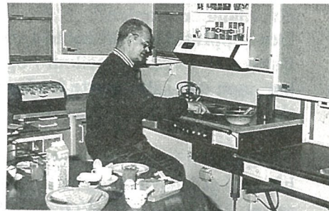
Treningskjøkkenet er riktig og nyttig.

funksjonsfriske er dette selvfølgeligheter, men for slagpasientene kan slike gjøremål virke uovervinnelige. Individuell trening og tilrettelegging er viktig for å gjøre pasientene selvhjulpne og fornye troen på seg selv.