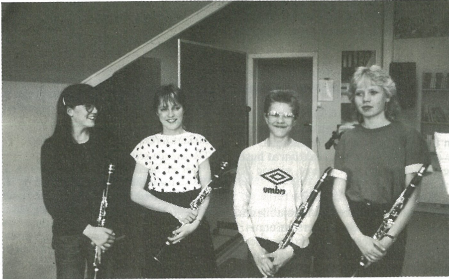
Blåsere fra Musikkskolen.

Billetter á kr. 50,- selges av skolens elever.