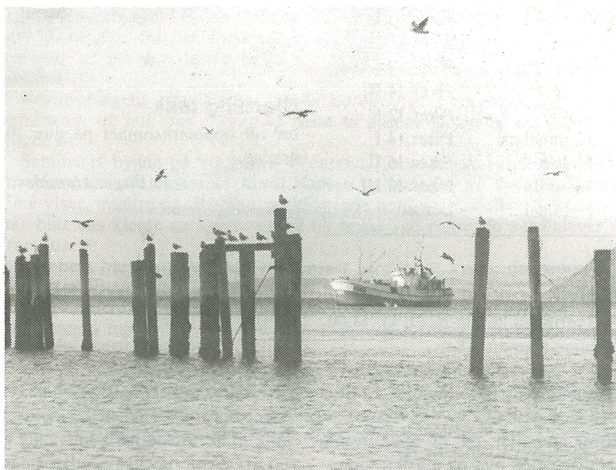
Millerskaia — en del av et kulturlandskap.

Bak overskriften står et spørsmålstegn, men når dette er kommet på trykk er kanskje saken avgjort og spørsmålstegnet strøket!