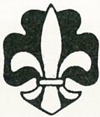
Ingvar Tøndel Vikhamar speidergr. tlf. 97 70 98

Skulle noen av dere mangle vervebrosjyrer, skal vi nok skaffe flere.