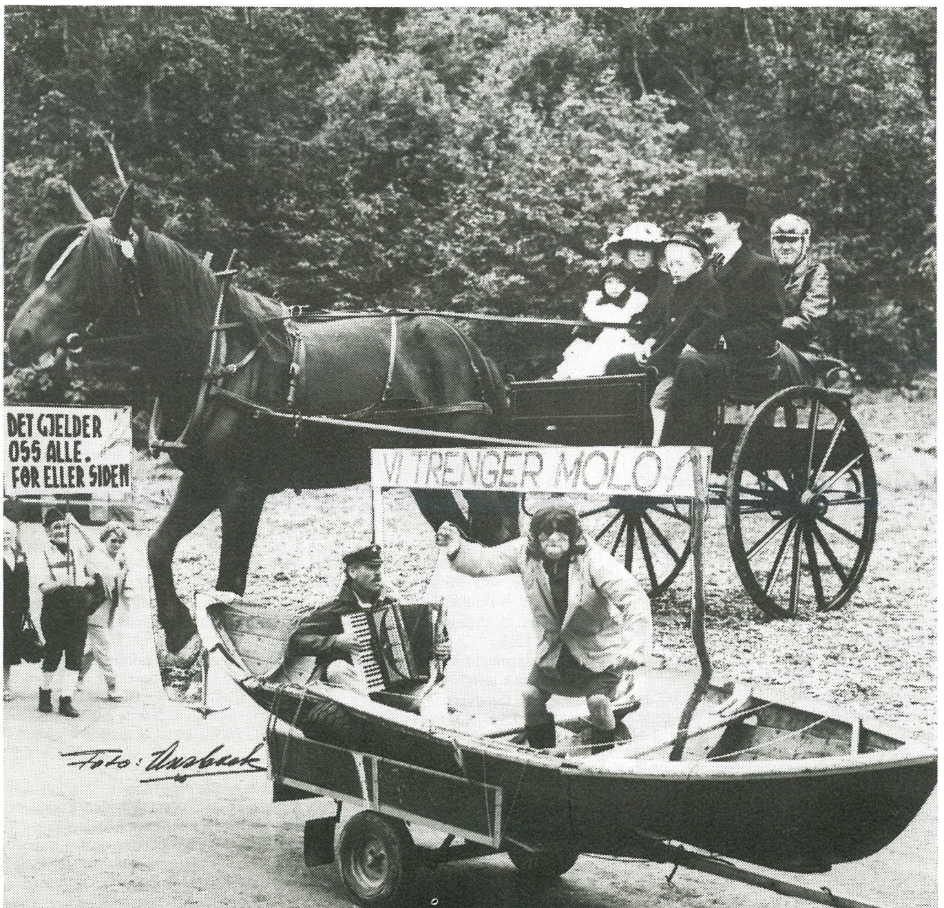
Hommelvikdagene ble avsluttet med stort og fargerikt opptog.