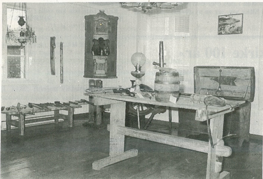
Gjenstander fra Birger Thorshaugs samling, fra slektsgården, Mostadmarka.