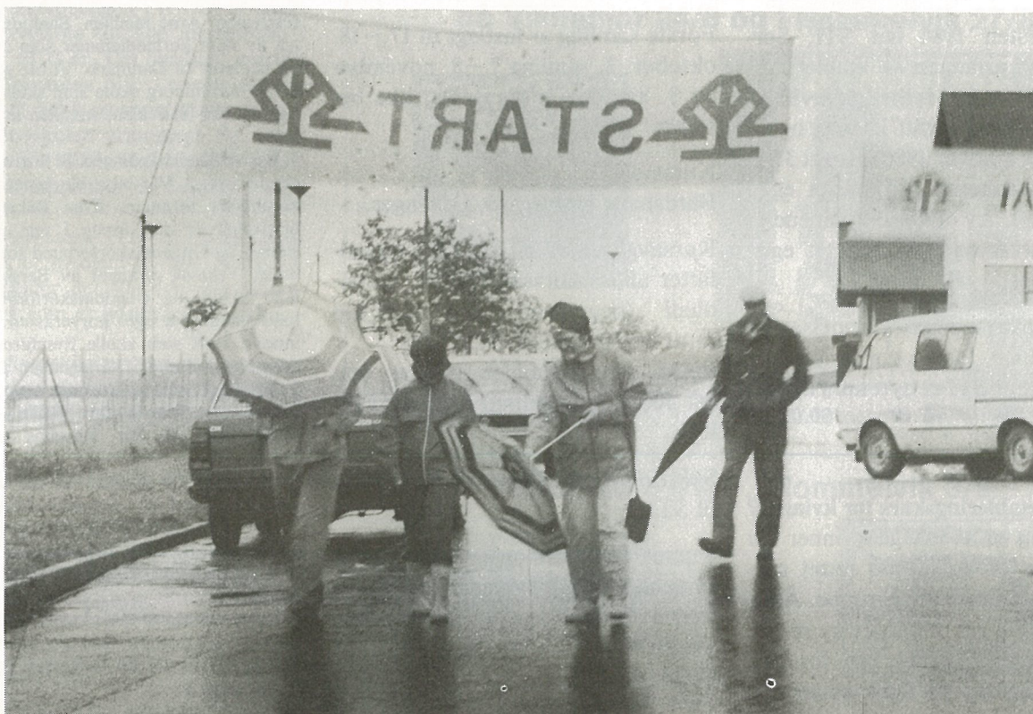
Deltakerne i turmarsjen «Malvik-mila» lot seg ikke skremme av et ufyselig vær.

Malvik Musikkorps var bokstavelig talt «i vinden» da de arrangerte turmarsjen «Malvik-mila» søndag 8. juni! Været var omtrent så ille som det kunne bli i de timene arrangementet pågikk, og det er all grunn til å gratulere de 120 deltakerne som trosset været og sikret seg det spesielle merket som alle får ved første gangs fullføring. «Malvik-mila» bød deltakerne på noe mer enn bare en marsj gjennom bygda vår, i og med at deltakerne fikk med seg et hefte med kart og opplysninger om ruta både av geografisk og lokalhistorisk art.