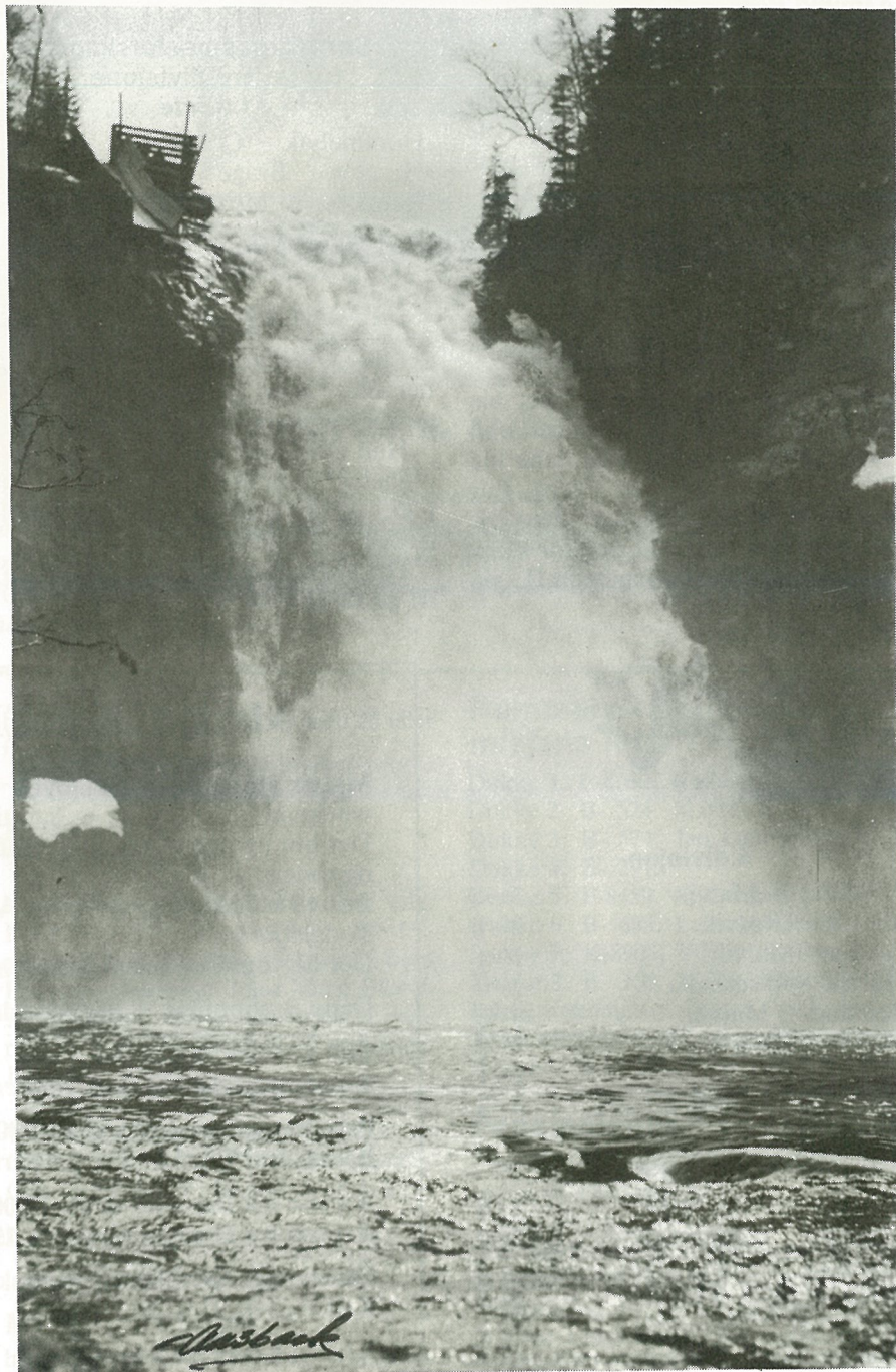
Storfossen som står foran kraftutbygging.

Når det gjelder laksefisket i Homla blir det hevdet at utbyggingen vil bli en fordel med jevnere vannstand i elva. Storfossen må en rekke med blir tørrlagt en del av året. Det er det vel ingen som liker, og slettes ikke de som er miljøverninteresserte.