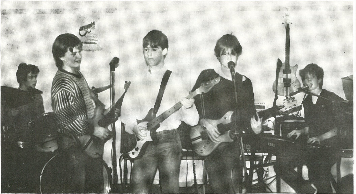
Bandrommet her representert ved «Stress-band».

Barn og ungdom bosatt i Malvik kommune har de siste årene fått et godt og variert tilbud om aktiv instrumentopplæring/musisering. Tilbudene om å lære og spille et instrument har vært populære, og mange unge har fått organisert opplæring gjennom kor, korps, AOF-kurs og den kommunale musikkskolen.