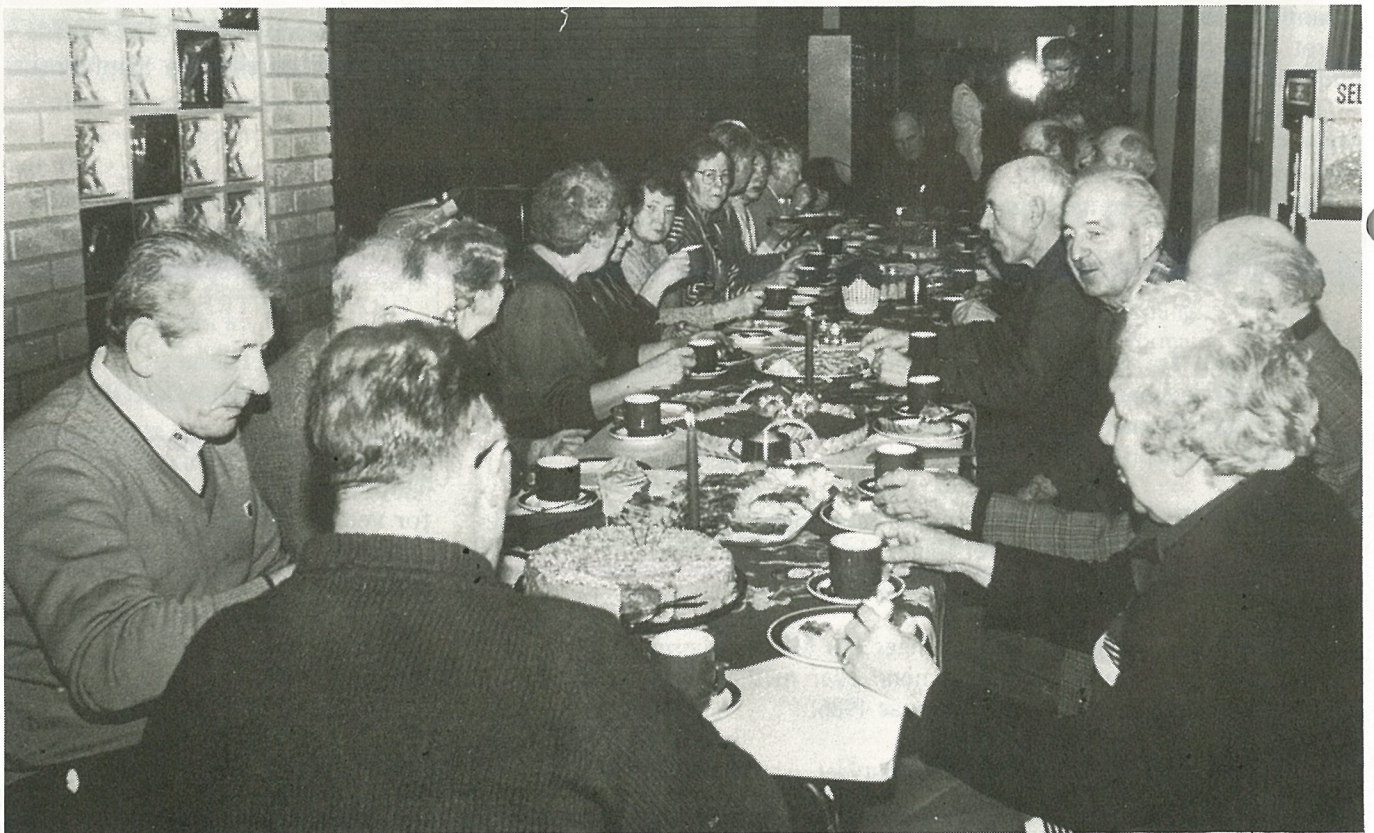
Fra juletilstelningen for pensjonister i Hommelvik svømmehall. Vi takker våre trofaste kunder for gaven og ønsker velkommen igjen i 1986.

(Se forøvrig annonse i dette nr. av Bygdebladet.)