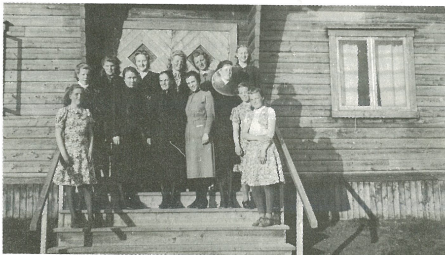
F.A. i Steinkjer 1942–43. Artikkelforfatteren står bakerst til venstre. Engleadjutanten sees foran til høyre. Brakka var en gave fra Sverige. Bildet er tatt i 1943.