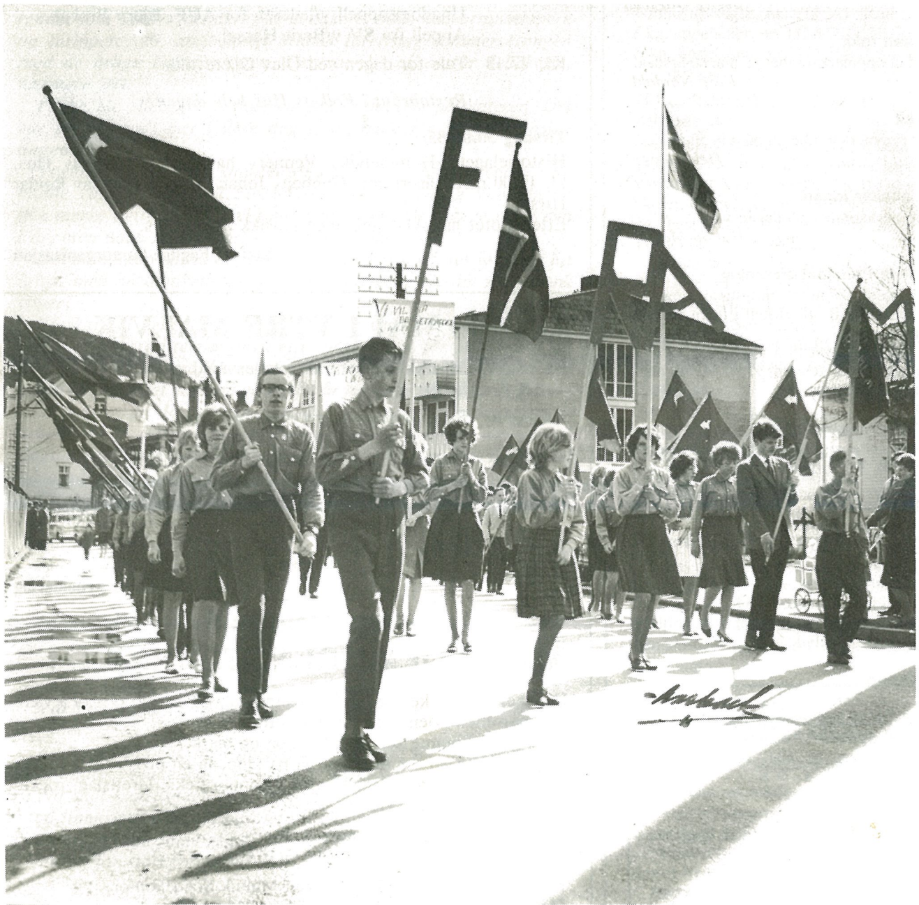
Her kommer Framlaget i spissen for barnetoget 1. mai i Hommelvik.