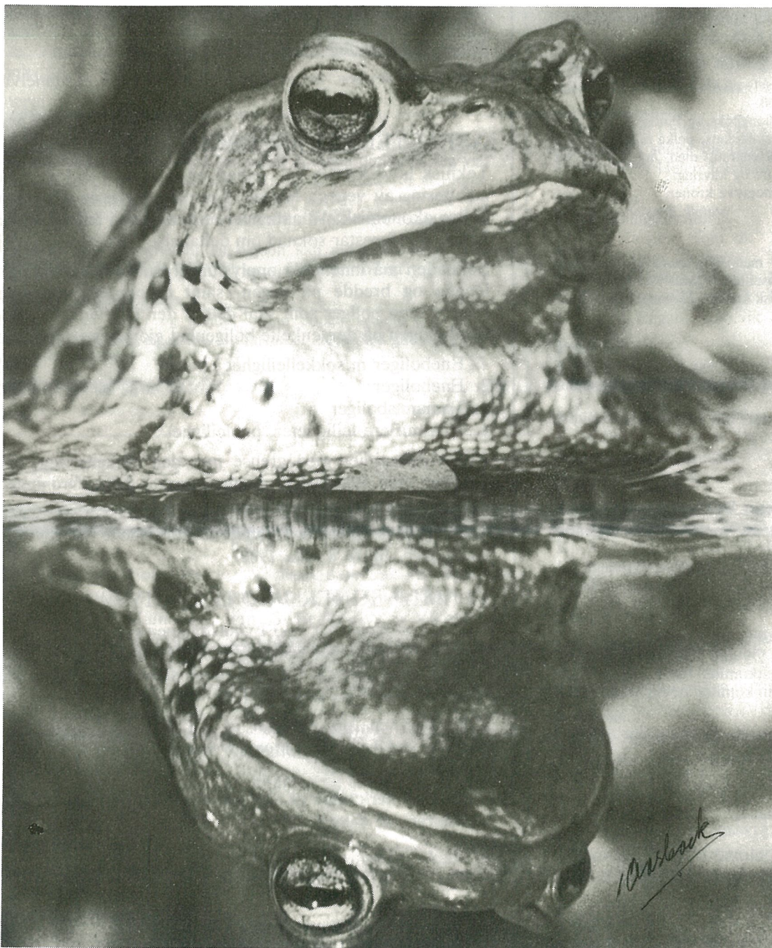
Opp av vinterdvalen, våren i sikte . . . .