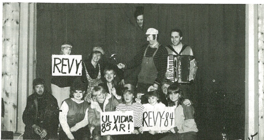
En del av revygjengen i jubileumsåret 1985.

I tillegg til egne miljøskapende aktiviteter har huset vært en del utleid slik at det til tider har vært et