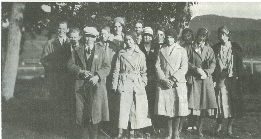
Lagets deltakere ved Noregs Ungdomslag's stevne på Fannrem i 1932.