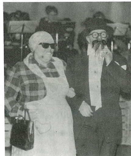
Det var sang, dans og trim ved ekteparet N.N.