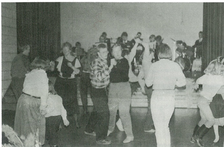
Dans var det hele kvelden.....