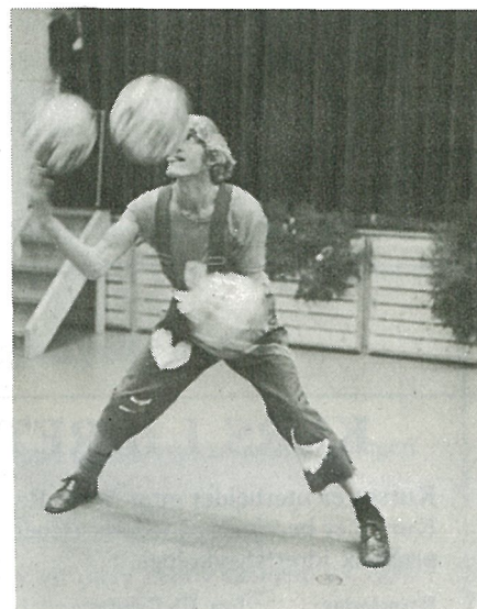
Sjongløren El Bambo.

Yngres avd. har 40 medlemmer, men med stort og smått. Av disse er det omlag 10 ungdommer som deltar i aktiv idrett i konkurranse med andre helsesportlag. Utøverne fra Malvik hevder seg svært bra i denne konkurransen.