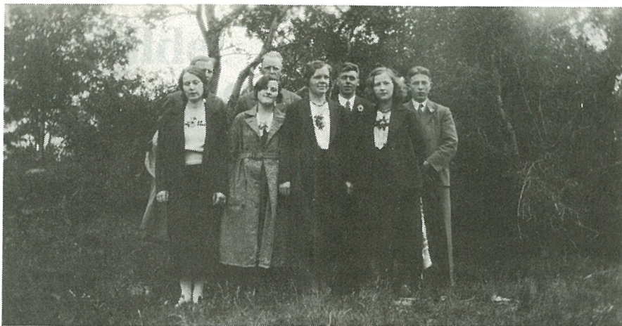
Noen av lagets deltakere ved en tur til Inderøy i 1932.