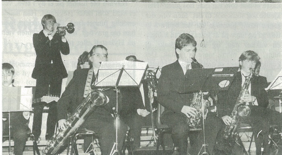
Basin Street Storband spilte til dansen og underholdninga.