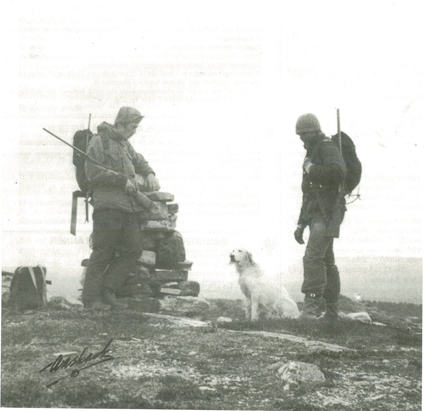
Dette er jegere på rypejakt som tar en tur på høyeste topp i vind og blåst.