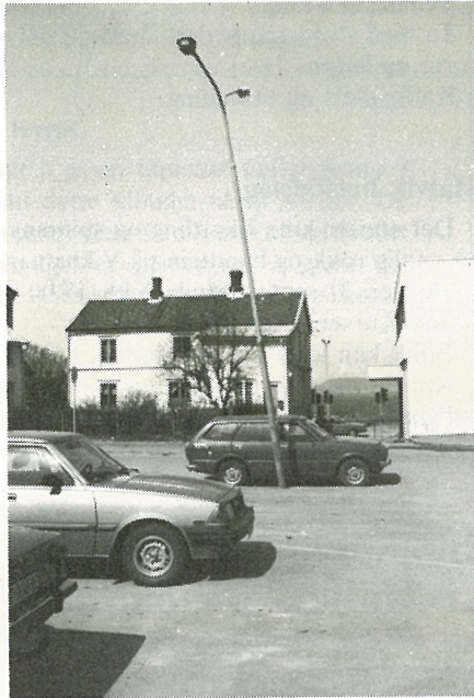
«Den skjeve stang i Vika».

Av planlegging selvfølgelig, sa jeg, hva ellers?