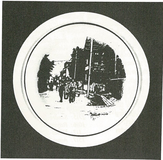
Den første tallerken viser et parti fra «Kjøbmannsgt.»

I forbindelse med Hommelvik Turnforenings 80-års Jubileum den 1/5 1983, har foreningen i samarbeid med kunstneren Roger Aasback og Hommelvik historielag, utarbeidet en meget sjelden samleserie med motiver fra Hommelvik i gamle dager. Motivene har kunstneren gjengitt fra gammelt fotomateriale. Serien består av seks porselentallerkener, to fra Hommelvik sentrum, Hommelvik kirke, Nygården, Karlslyst Gård og Hommelvik Bruk.