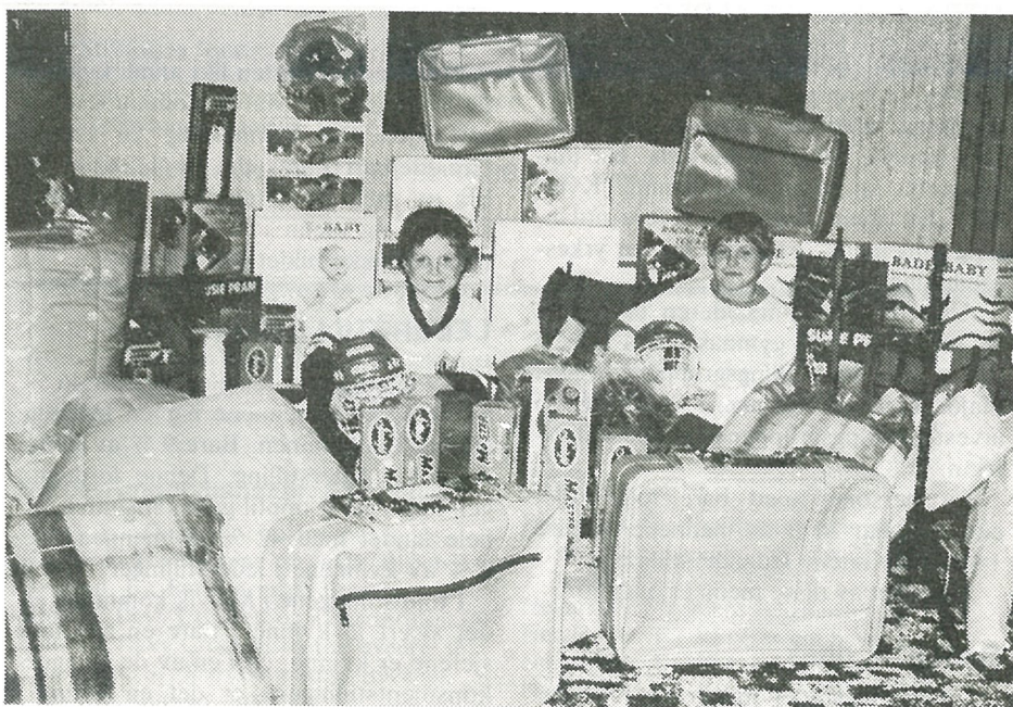
Et utvalg av de flotte premiene som kan vinnes ved å kjøpe adventskalenderen, presentert av to hockey-gutter.