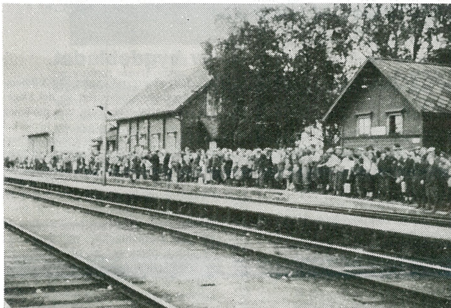
Bærplukkere fra Trondheim venter på tog på Hommelvik jernbanestasjon for tilbaketur til byen søndag kveld 5. september 1943.

Skolestyret har gjort dette vedtak: Søknaden fra fylkeslegen om å få gjennomføre tannlegeundersøkelse blant elever i 8. klasse innvilges.