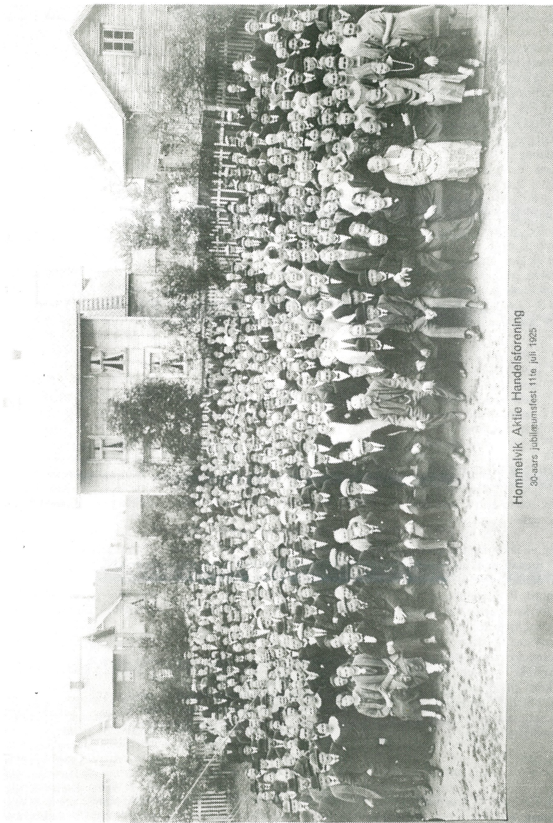
Hommelvik Aktie Handelsforening 30-års jubilæumsfest 11te juli 1925

Hommelvik Samvirkeklag som ble stiftet i 1895 hadde 30-årsjubileumsfest i Folkets Hus i 1925. Vårt bilde er fra gårdsplassen til Folkets Hus, og eldre folk, spesielt i Hommelvik, vil nok dra kjensel på mange av festdeltakerne.