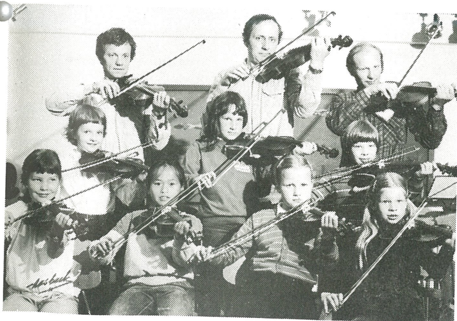
ASPIRANTGRUPPA VED MALVIK SKOLEORKESTER