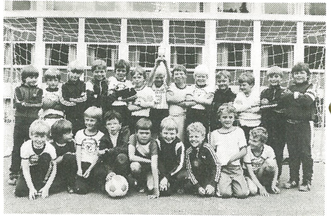
Malvik's miniputter f. 1975 og senere med pokal for andreplassen.