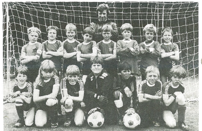
Malvik-miniputt f. 1974.