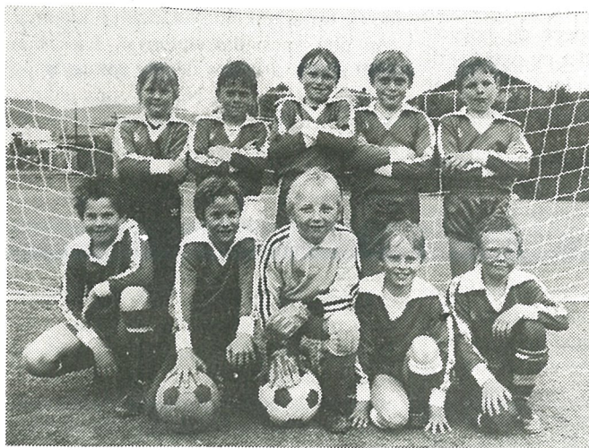
Hommelvik-miniputt f. 1974.