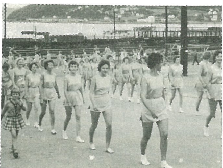
H.vik Turnforening defilerer gjennom Vika før en oppvisning i 1959.