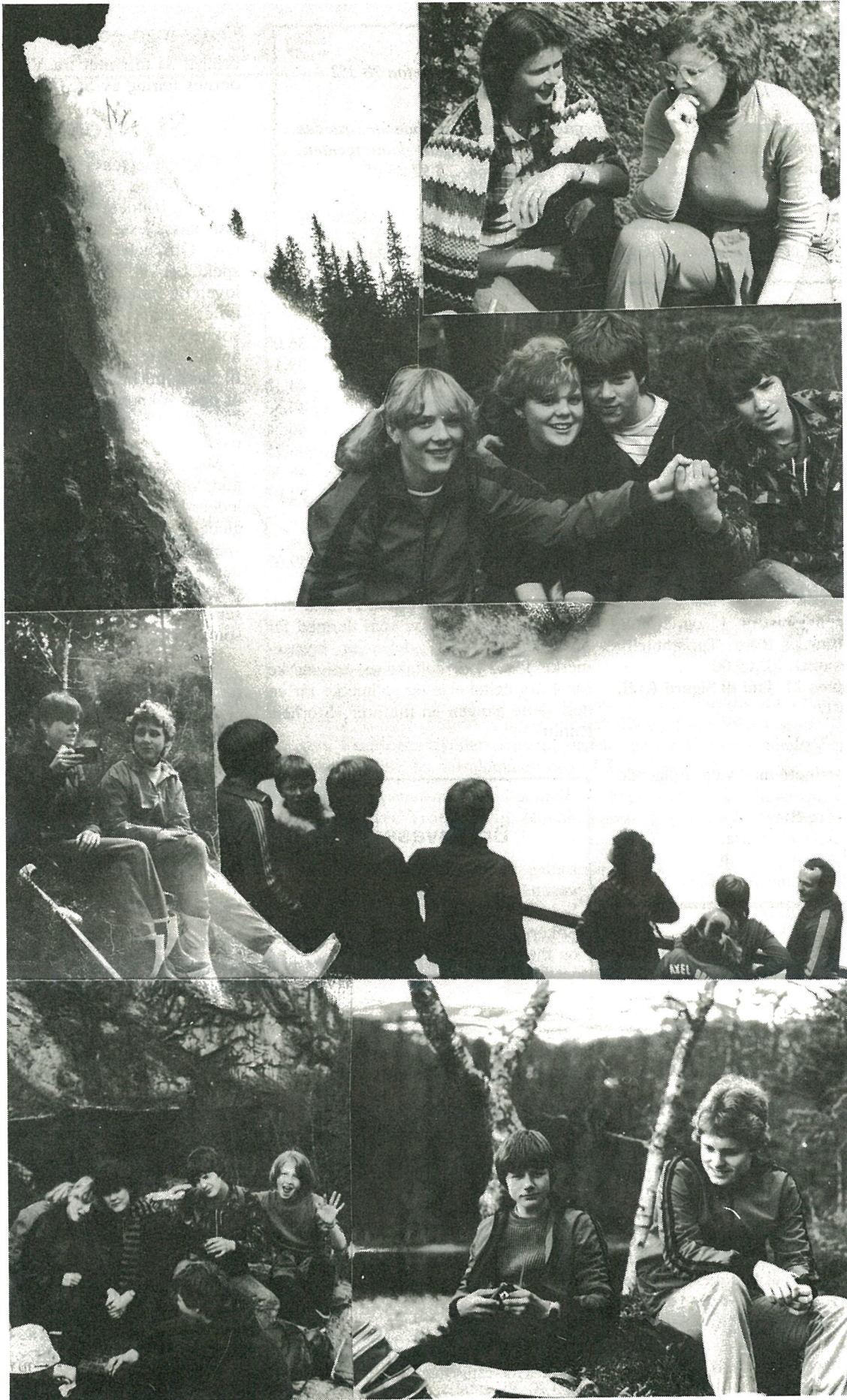
8.klassingene ved Hommelvik ungdomsskole tilbrakte i slutten av mai en uke på leirskole i Teveldal. Elevene var innkvartert på Teveltunet, hvor de hadde utgangspunkt for forskjellige aktiviteter som kanopaddling, førstehjelp, bålaging, natursti og fjelltur. Bildemontasjen viser elever og lærere fra klassene 8c og 8d.