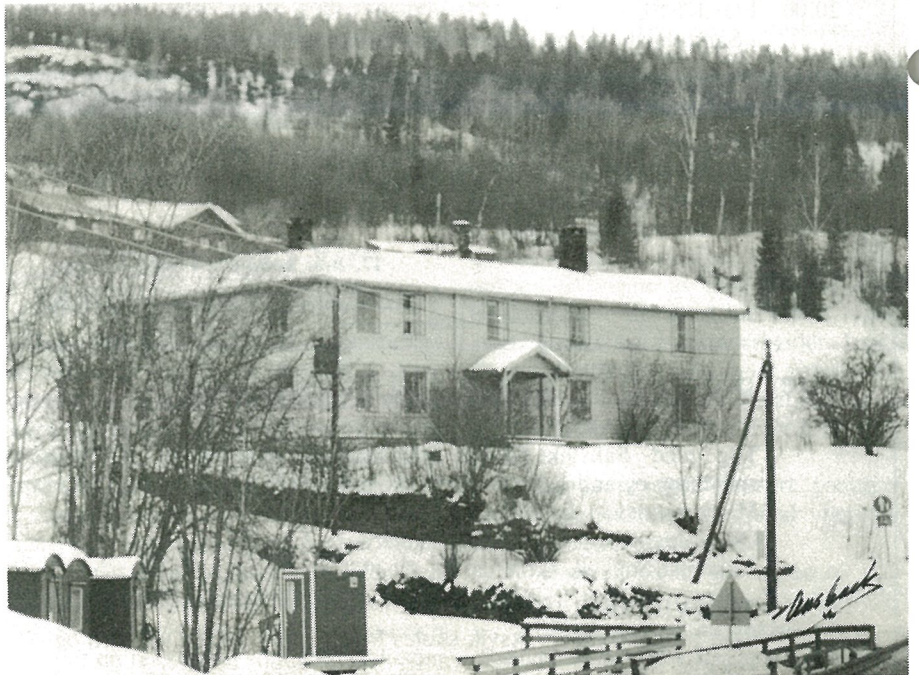
Elvebakken — riving eller bevaring? Diskusjonen går høyt i Hommelvik for tiden.

Med hilsen Historielaget Hommelviks Venner Styret