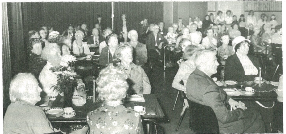
Bra oppmøte også på «eldretreffet» i Folkets Hus.