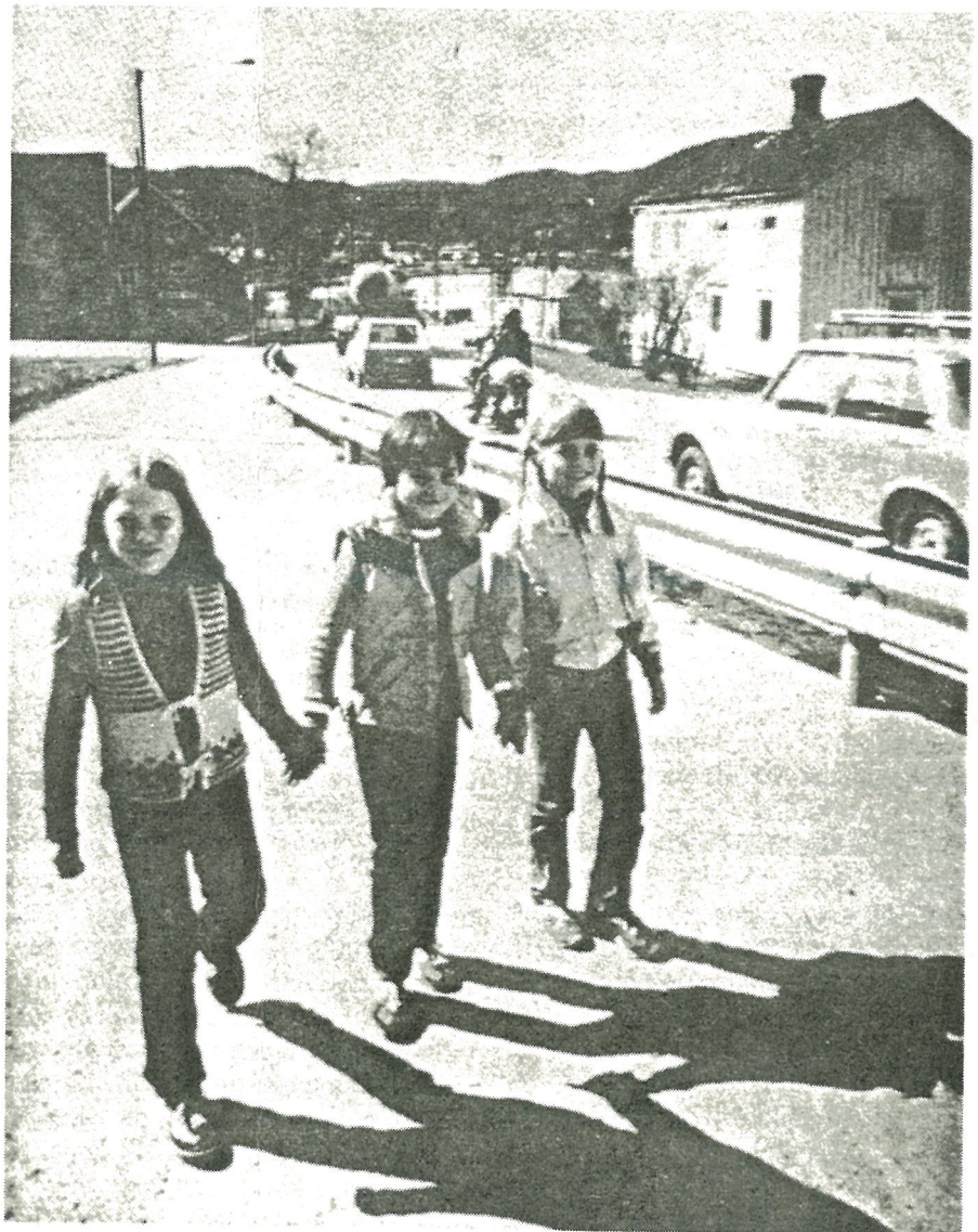
Eksempel på ferdigbygget gang- og sykkelveg i Hommelvik.

planer og satt opp lister for prioritering av disse. Endel av tiltakene kan iverksettes straks og trenger ingen politisk behandling, mens andre — som for eksempel gang- og sykkelveger — krever