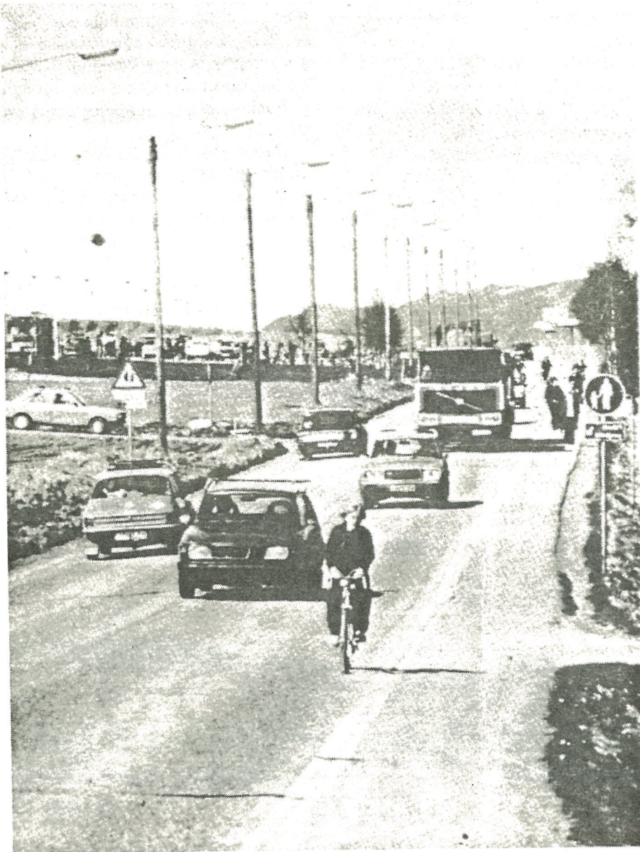
Dagens situasjon ved Vikhamar skole i Malvik.