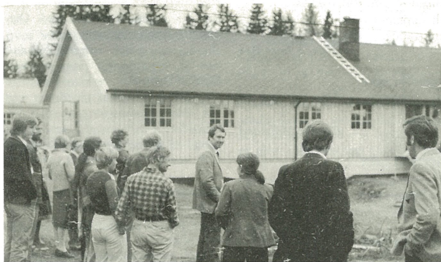
Her beskes nybygget på gården.

I forbindelse med sitt siste møte foretok kommunestyret ei befaring i bygda, og var bl.a. innom Jøssåsen Landsby. Som en gave til Landsbyen ble det overrakt ei gårdsklokke i ren klokkebronse, med armatur og gravering.