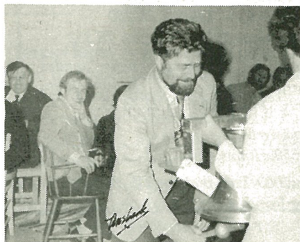
Ordføreren prøver klangen i klokka.

I forbindelse med sitt siste møte foretok kommunestyret ei befaring i bygda, og var bl.a. innom Jøssåsen Landsby. Som en gave til Landsbyen ble det overrakt ei gårdsklokke i ren klokkebronse, med armatur og gravering.