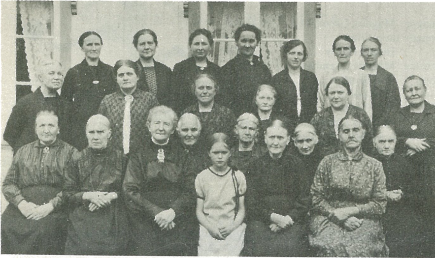
Kvinneforeningen fotografert i 1930.