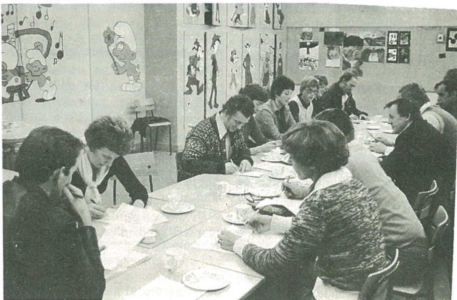
Fra det konstituerende møte på Vikhamar skole.

Vi håper at dette skal bli et slagkraftig organ, som kan bli til nytte for musikk livet i Malvik, og bidra til å styrke samarbeidet mellom den indre og ytre del av vår kommune.