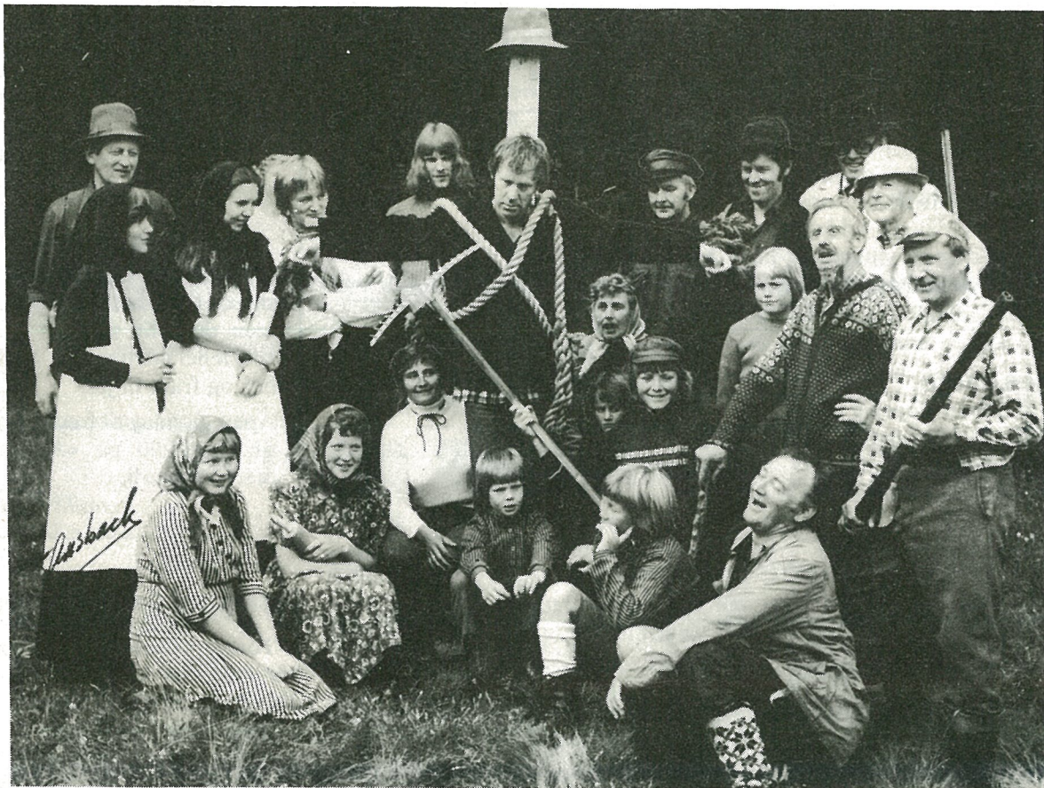
Her ser vi endel av aktørene som har vært med i filmen.

Da det er mange innbundne til premieren vil de øvrige plassene bli forbeholdt mostingene. Senere vil filmen bli vist i Folkets Hus Hommelvik.