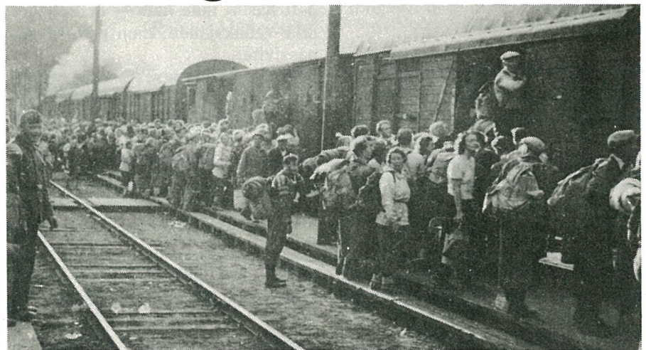
Vi brakte i nr. 16 et bilde fra tyttebær-rushet under krigen. Vi har fått et til, og det viser bærplukkerne idet de entrer toget på Hommelvik stasjon. Ikke så behagelig transport kanskje, men det gikk da det også.