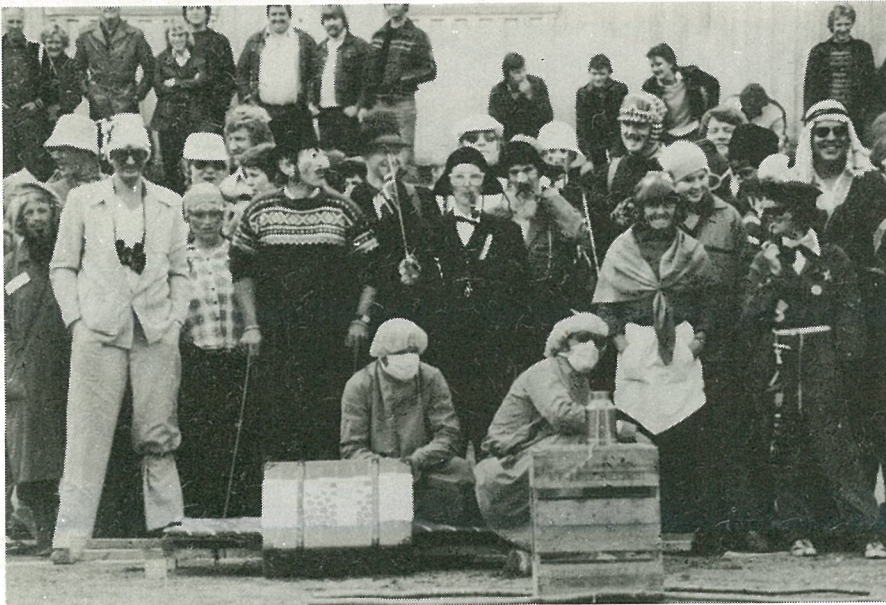
En del av de 60 deltakerne klare for kamp. I forgrunnen sees vandrepokalen, formet som et meierispann, som det kjempes om.