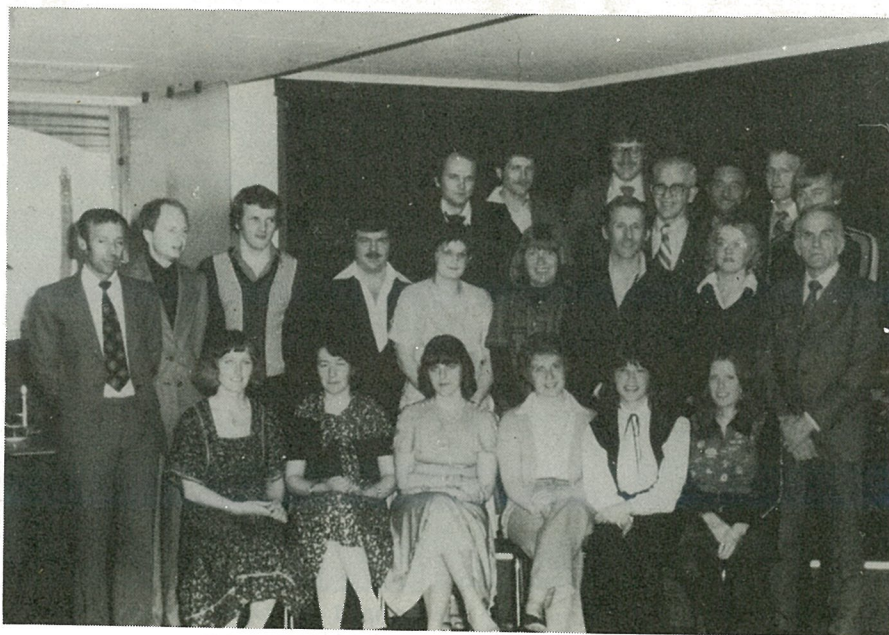
Dette er avgangsklassen i 1969 ved Malvik realskole i Hommelvik. En liten sammenkomst for lærere og elever ble holdt i kaféen på Hundhamaren.