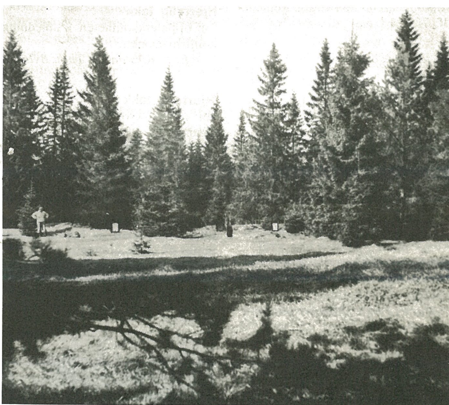
Her sto husene der Johan Nygaardsvold ble født.