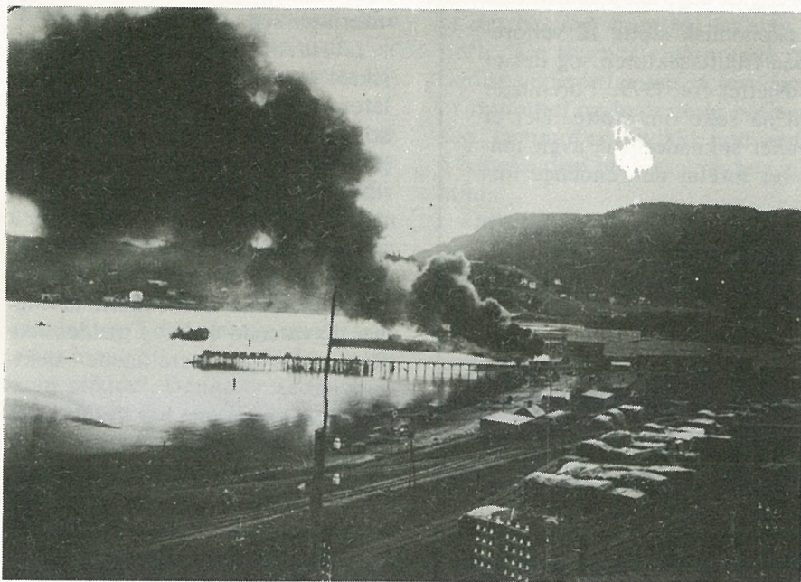
Fra krigens dager. Et tysk fly som var trukket opp i fjæra ved «Bruket», brenner. Brannårsaken kjennes ikke. Bildet er knipset «illegalt».