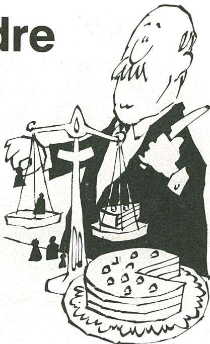
DELING AV ARVELATERS FORMUE

Når en person dør, skal de midler han etterlater seg gå i arv til slekt og ektefelle etter de regler som arveloven fastsetter. Hvis arvelateren ønsker noe annet, må han opprette testament.