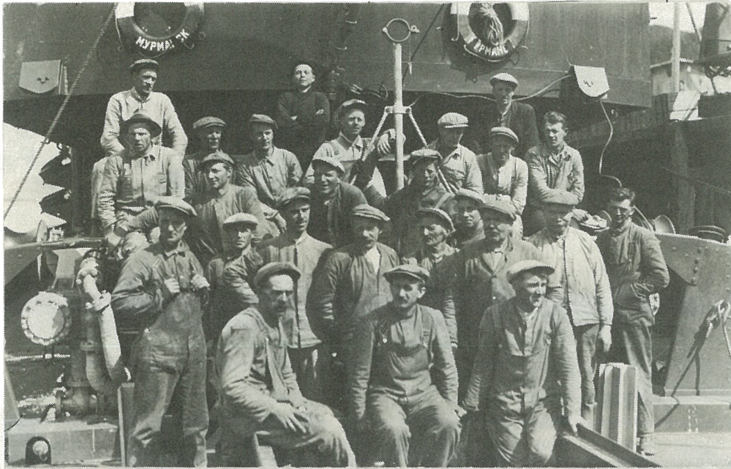
Losse- og lastearbeidere i Muruvik ombord i en russisk tråler, NYPMAHCK, i 1930.

Tråleren var blitt bygd og sjøsatt i Tyskland og på sin førstereis var den innom Muruvik og lastet krom for Murmansk.