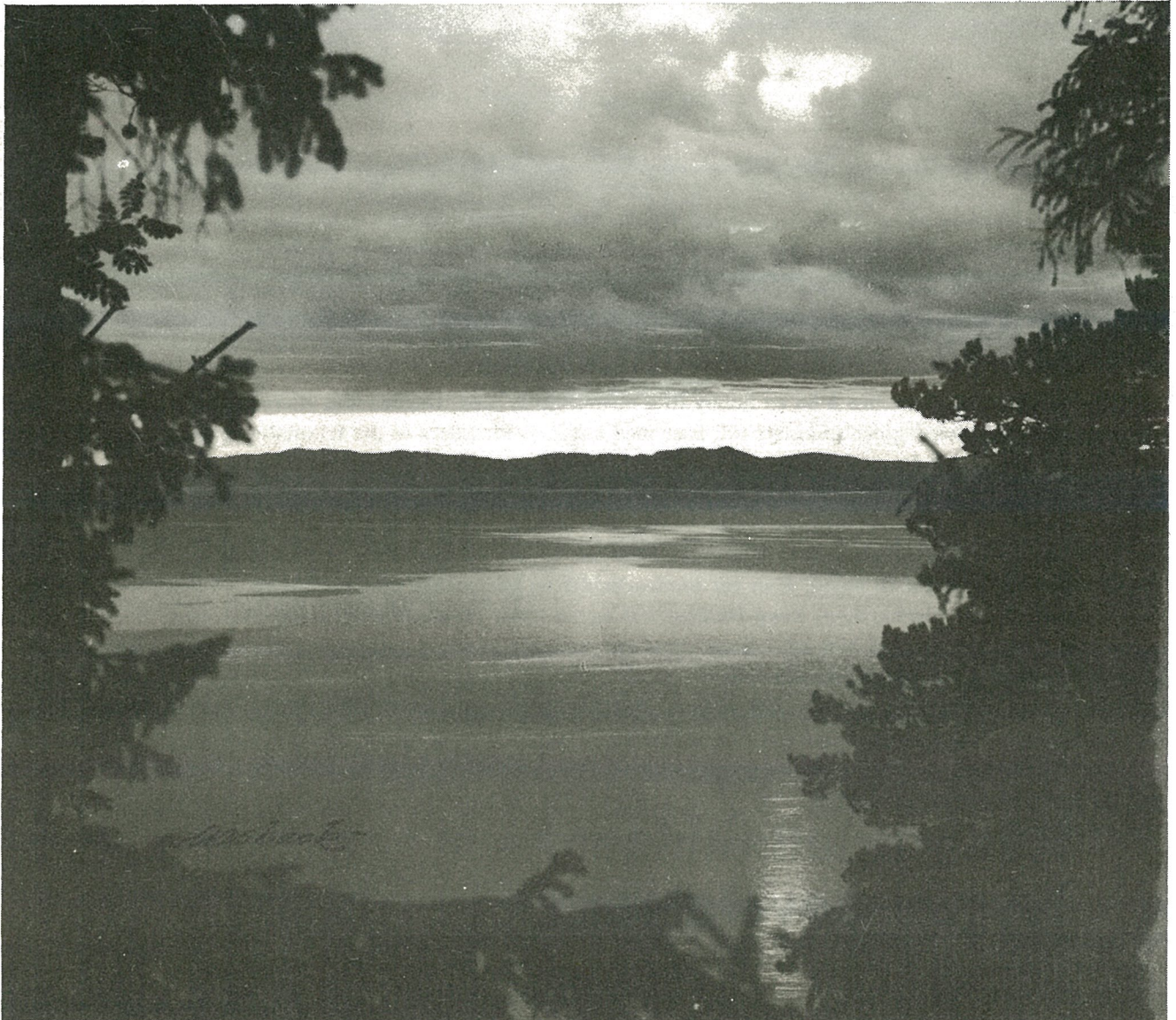
Kveldsstemming over sjø og fjell sett fra Gjevingåsen med Leksvikfjellene i bakgrunnen.