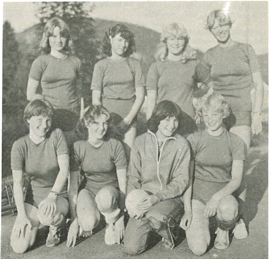
Hommelvik Idrettslags håndball-lag for jenter, klasse 13 år, som av idrettslaget er blitt tildelt kommunens innsatspremier for 1977 med disse resultater: