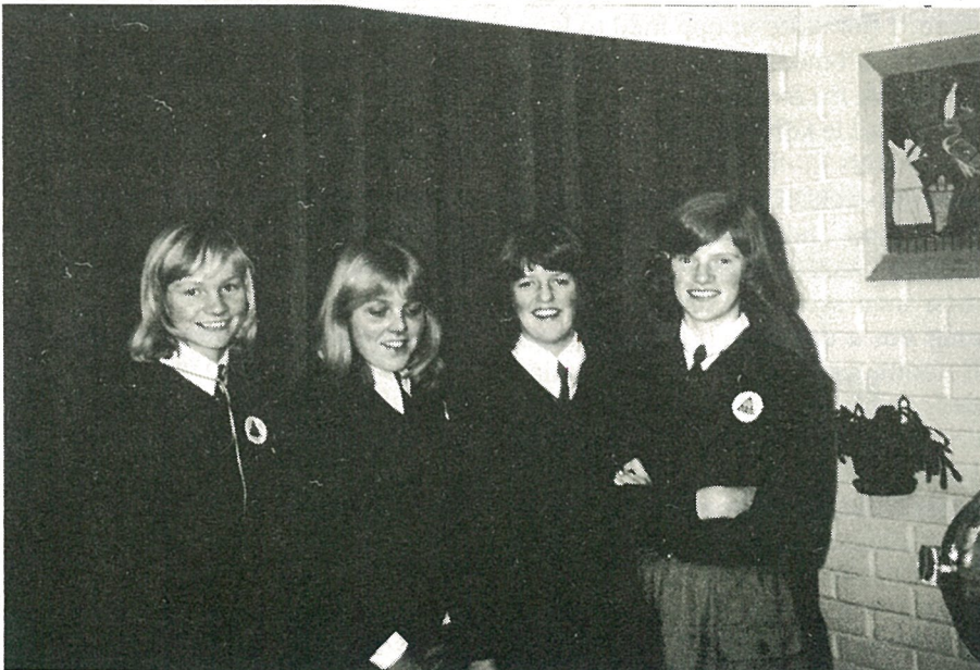
Fire av vandrerne som ser fram til glade leirdager på Øysand.