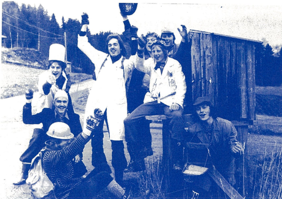
Noen av deltakerne ved melkerampa ved Hallien.