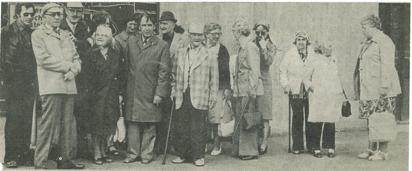
NORSKE OG SVENSK E DELTAKER E