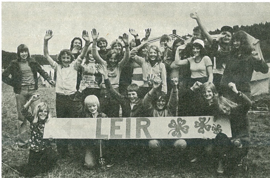
Noen av medlemmene fra 4H-klubbene i Malvik som deltok på leiren.